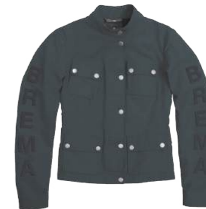
Dark Grey 305

Taglie disponibili: dalla XS alla XL - Available Sizes: from size XS to size XL