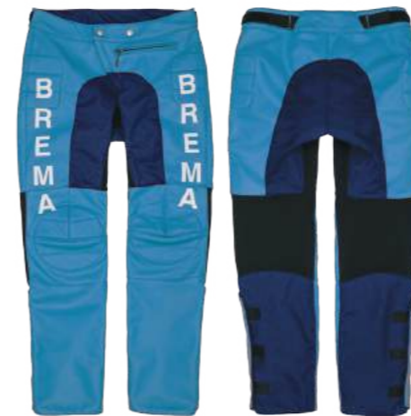
L. Blue/Navy 548