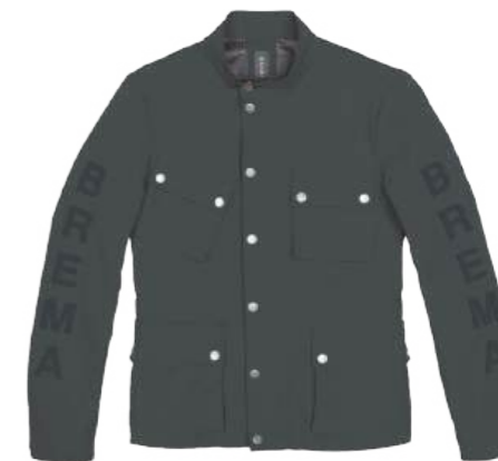
Dark Grey 305