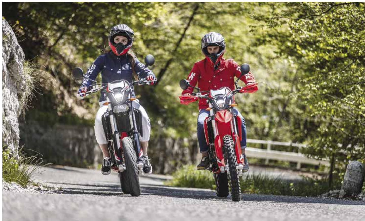
OFF ROAD SPIRIT