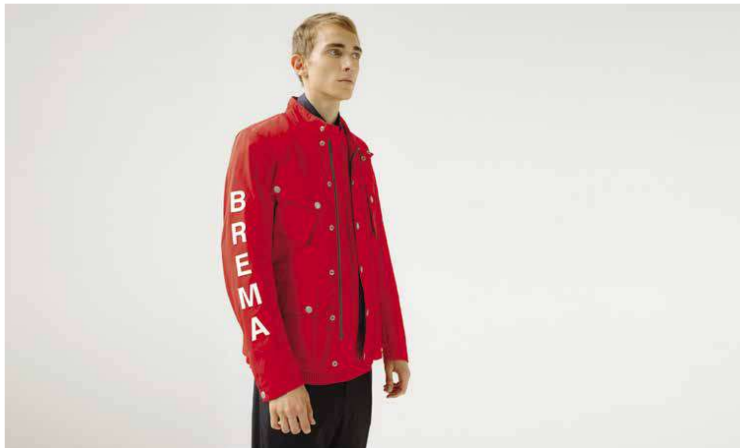
OFF ROAD SPIRIT