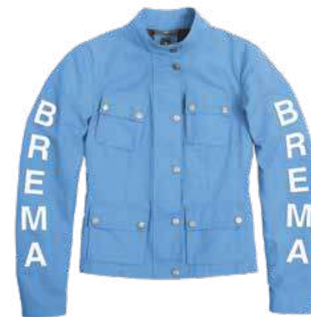
Light Blue 049

• Fornita di serie, indossabile pure separatamente, di un corpetto certificato con le protezioni alle spalle e gomiti e la possibilità di inserire pure il paraschiena • Realizzata in Nylon e Cotone • Foderata internamente con rete • Logo Brema da 36 cm in ecopelle • Quattro tasche sul davanti e una interna.