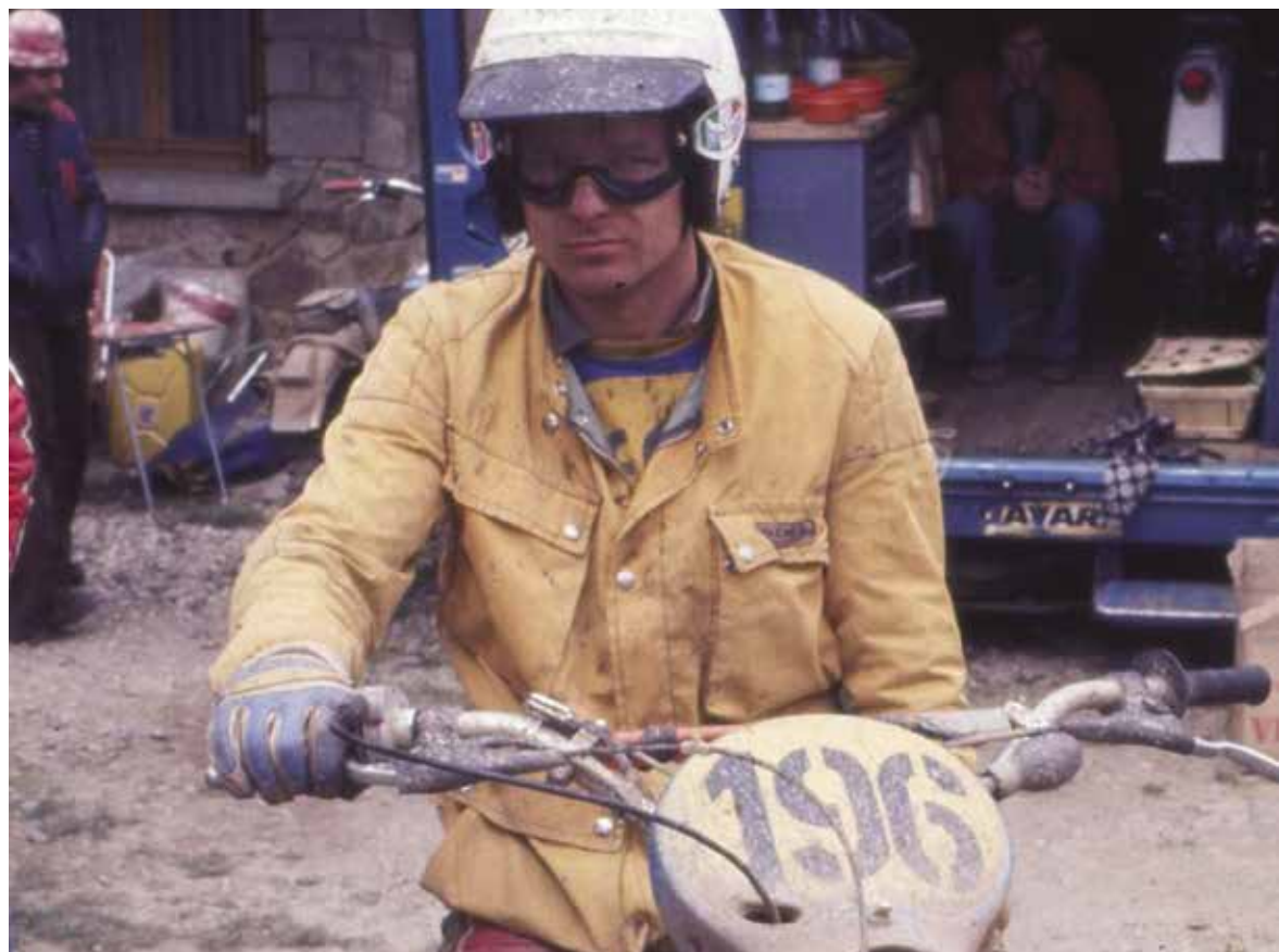
OFF ROAD SPIRIT