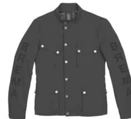
Dark Grey 305