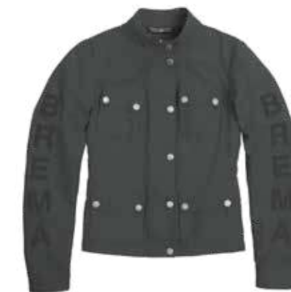
Dark Grey 305

Taglie disponibili: dalla XS alla XL - Available Sizes: from size XS to size XL