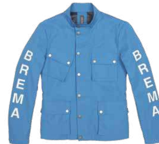
Light Blue 049

• Fornita di serie, indossabile pure separatamente, di un corpetto certificato con le protezioni alle spalle e gomiti e la possibilità di inserire pure il paraschiena • Realizzata in Nylon e Cotone • Foderata internamente con rete • Logo Brema da 36 cm in ecopelle • Quattro tasche sul davanti e una interna.