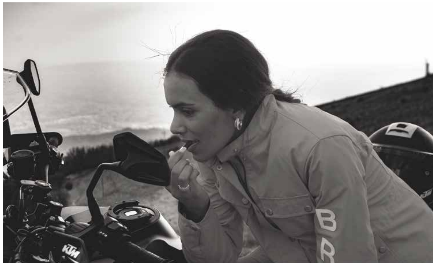
OFF ROAD SPIRIT