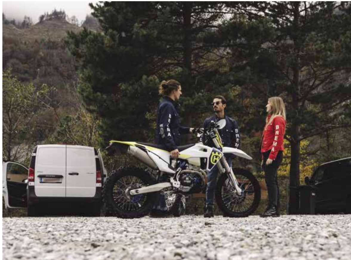
OFF ROAD SPORT