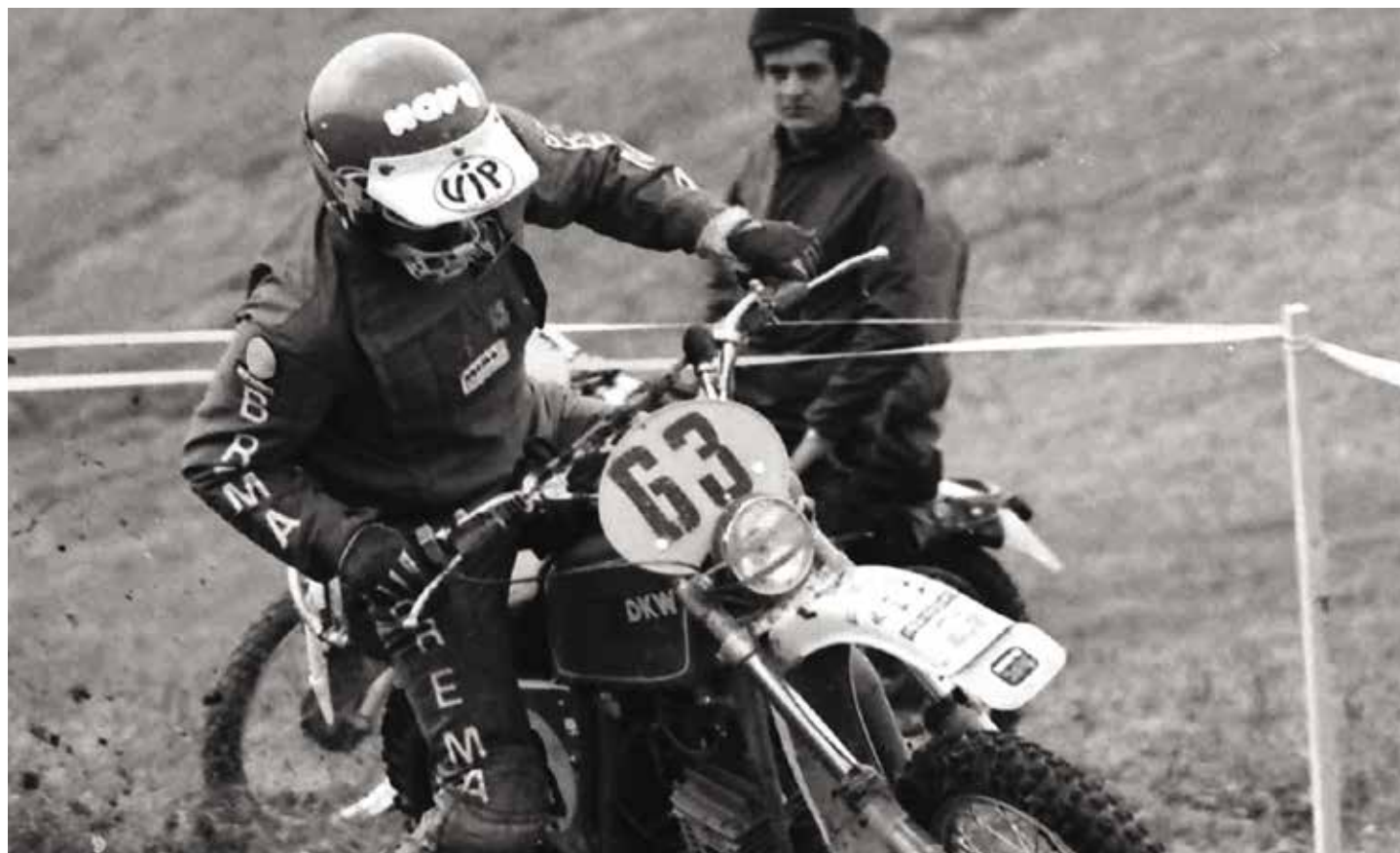
OFF ROAD SPORT