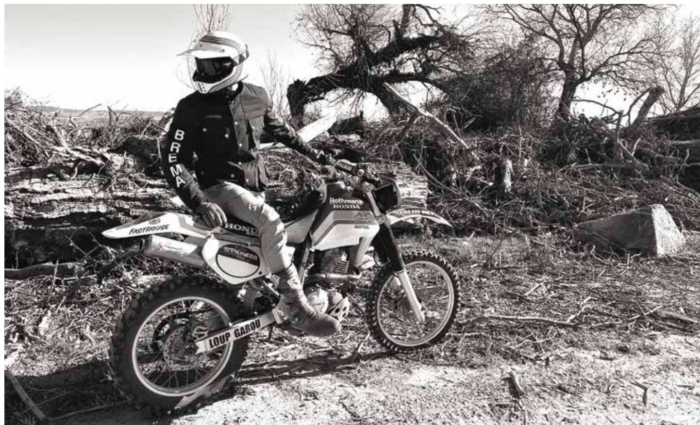
OFF ROAD SPIRIT