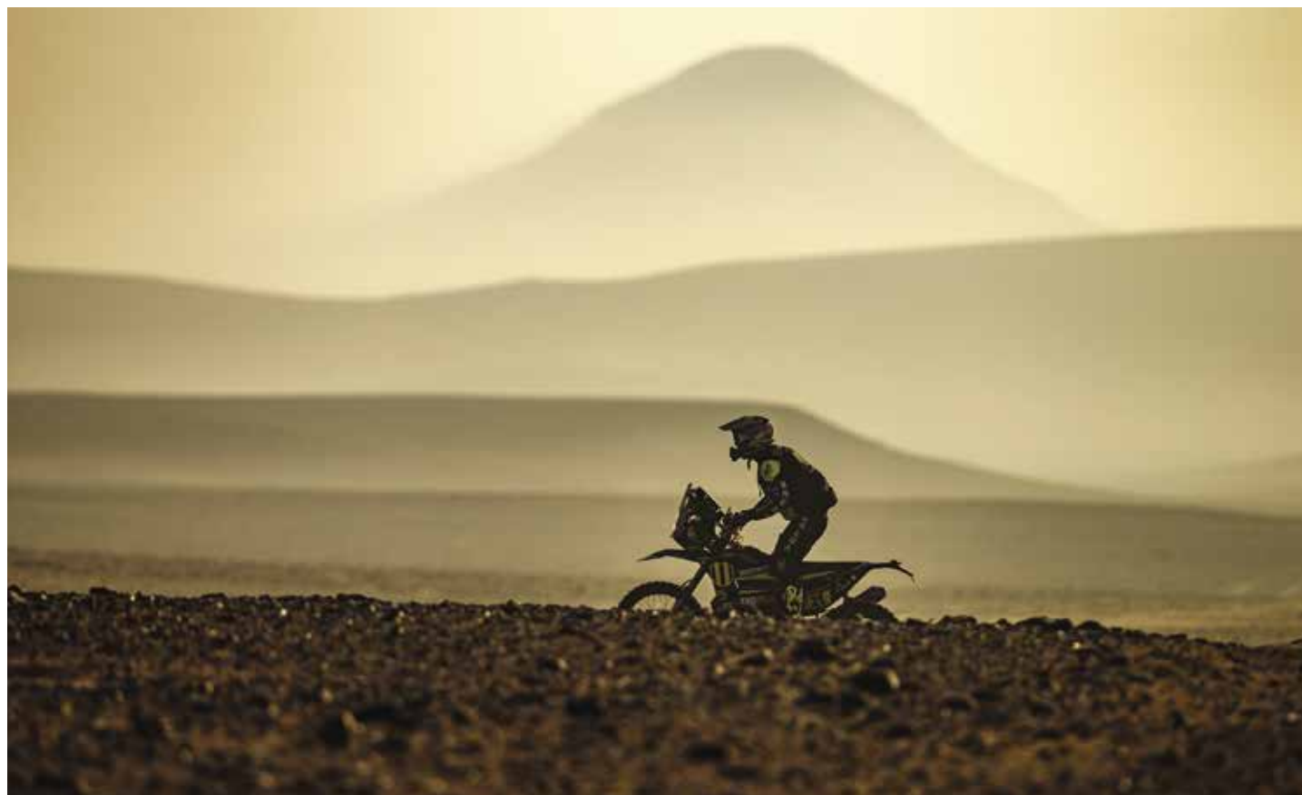
OFF ROAD SPORT