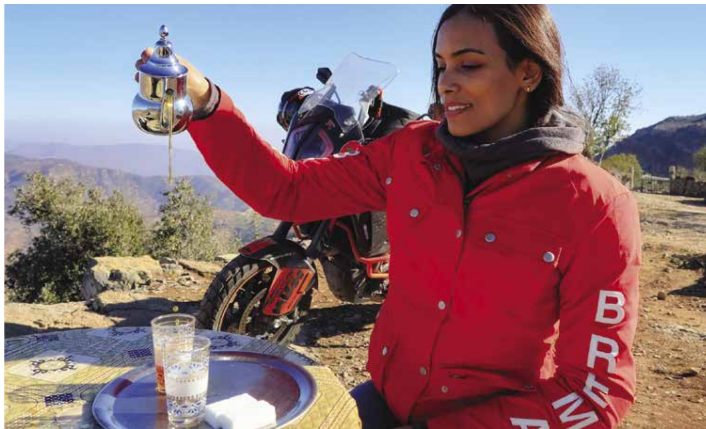
OFF ROAD SPIRIT