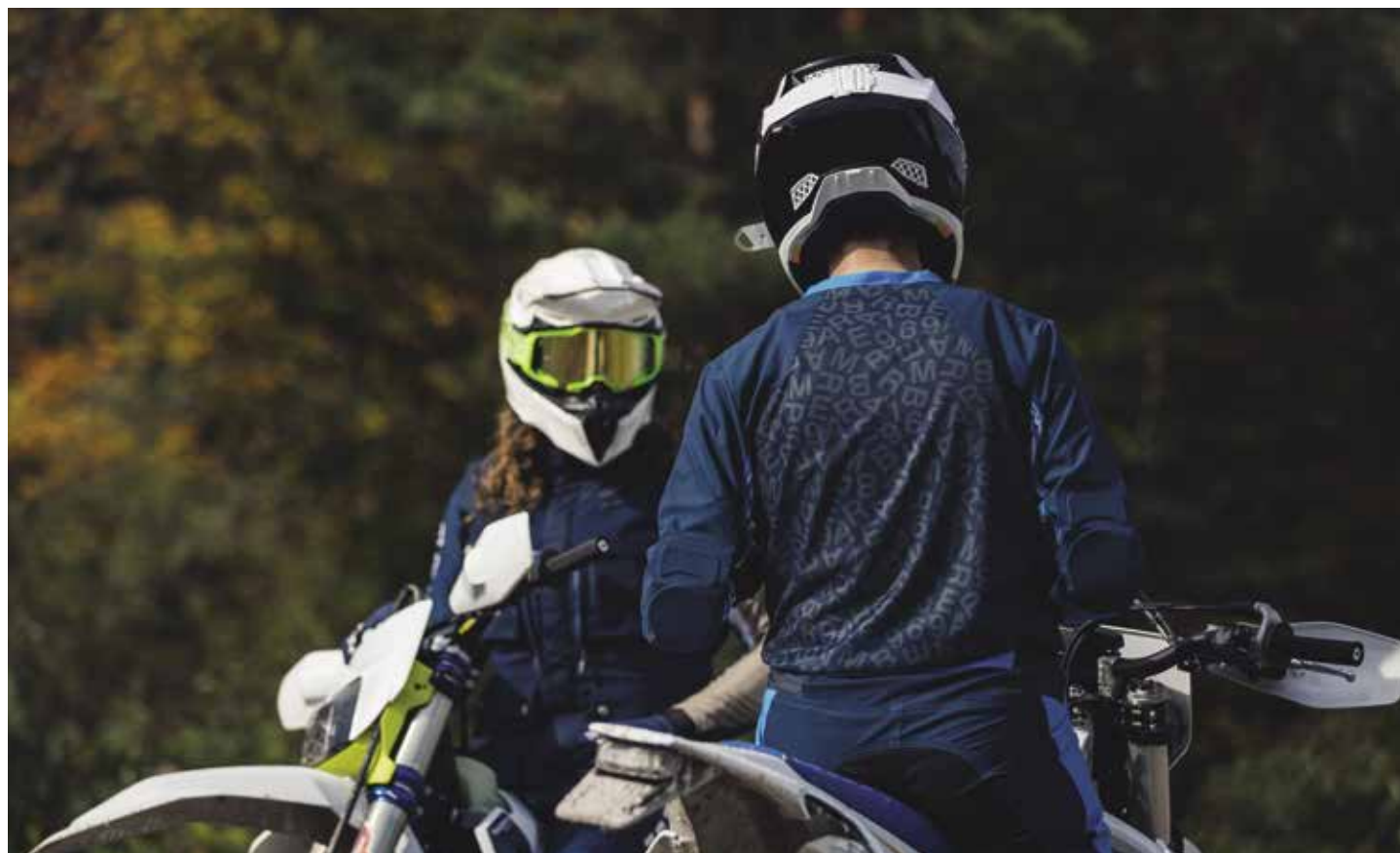
OFF ROAD SPORT