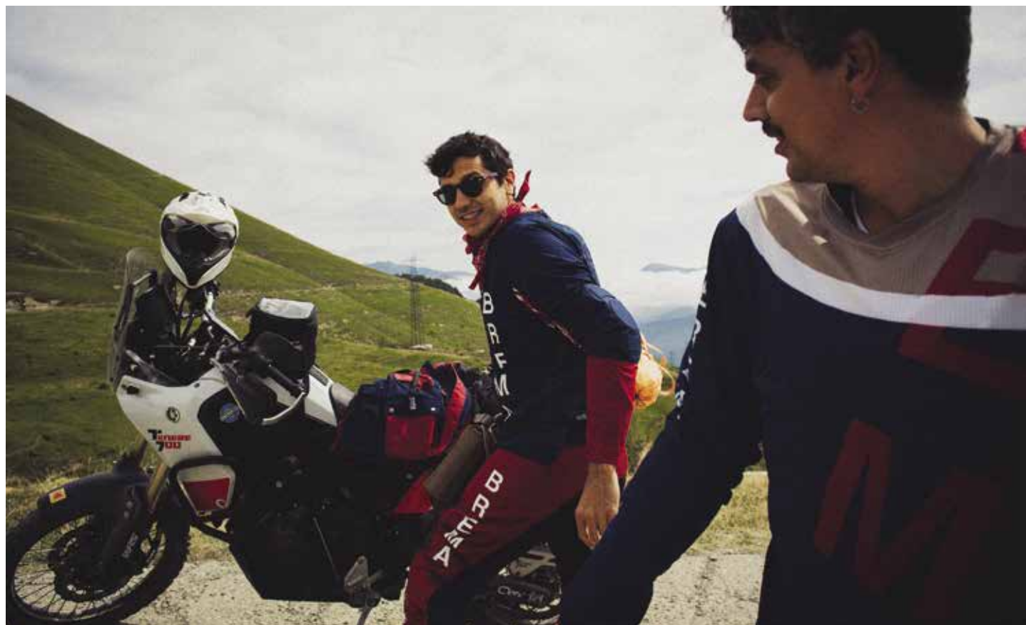
OFF ROAD SPORT