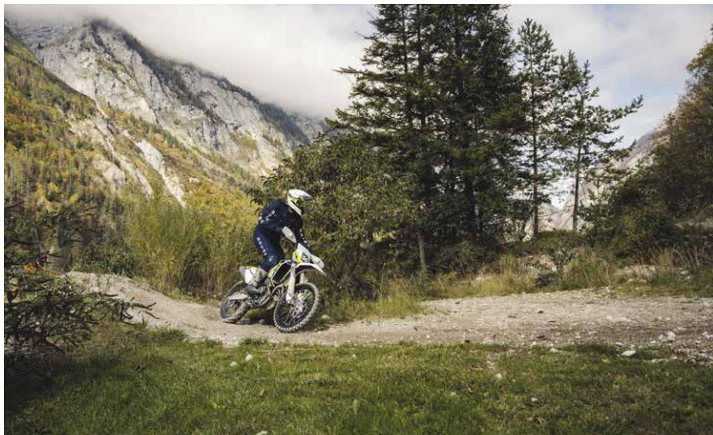
OFF ROAD SPORT