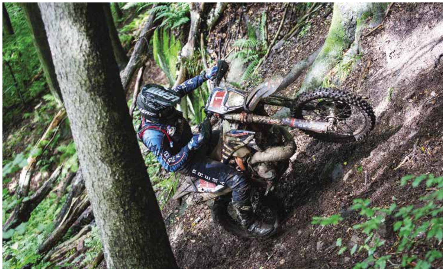
OFF ROAD SPORT