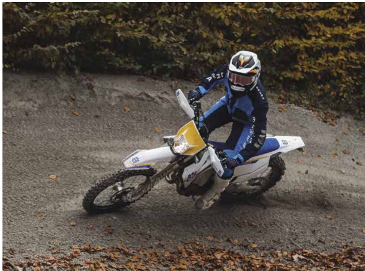
OFF ROAD SPORT