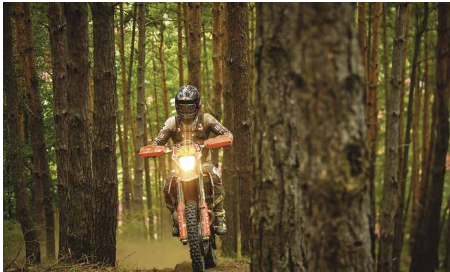
OFF ROAD SPORT