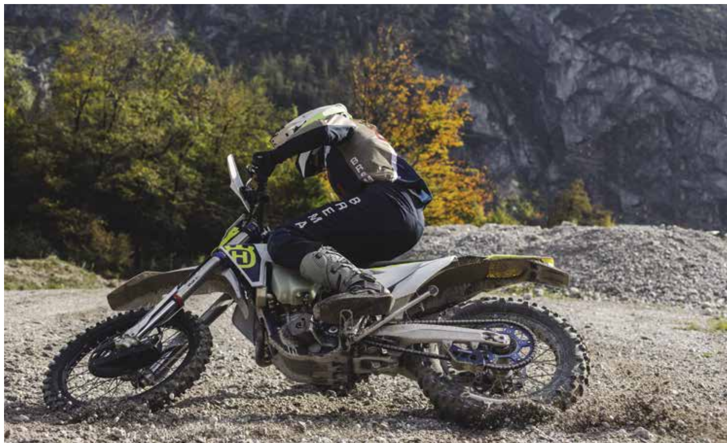
OFF ROAD SPORT