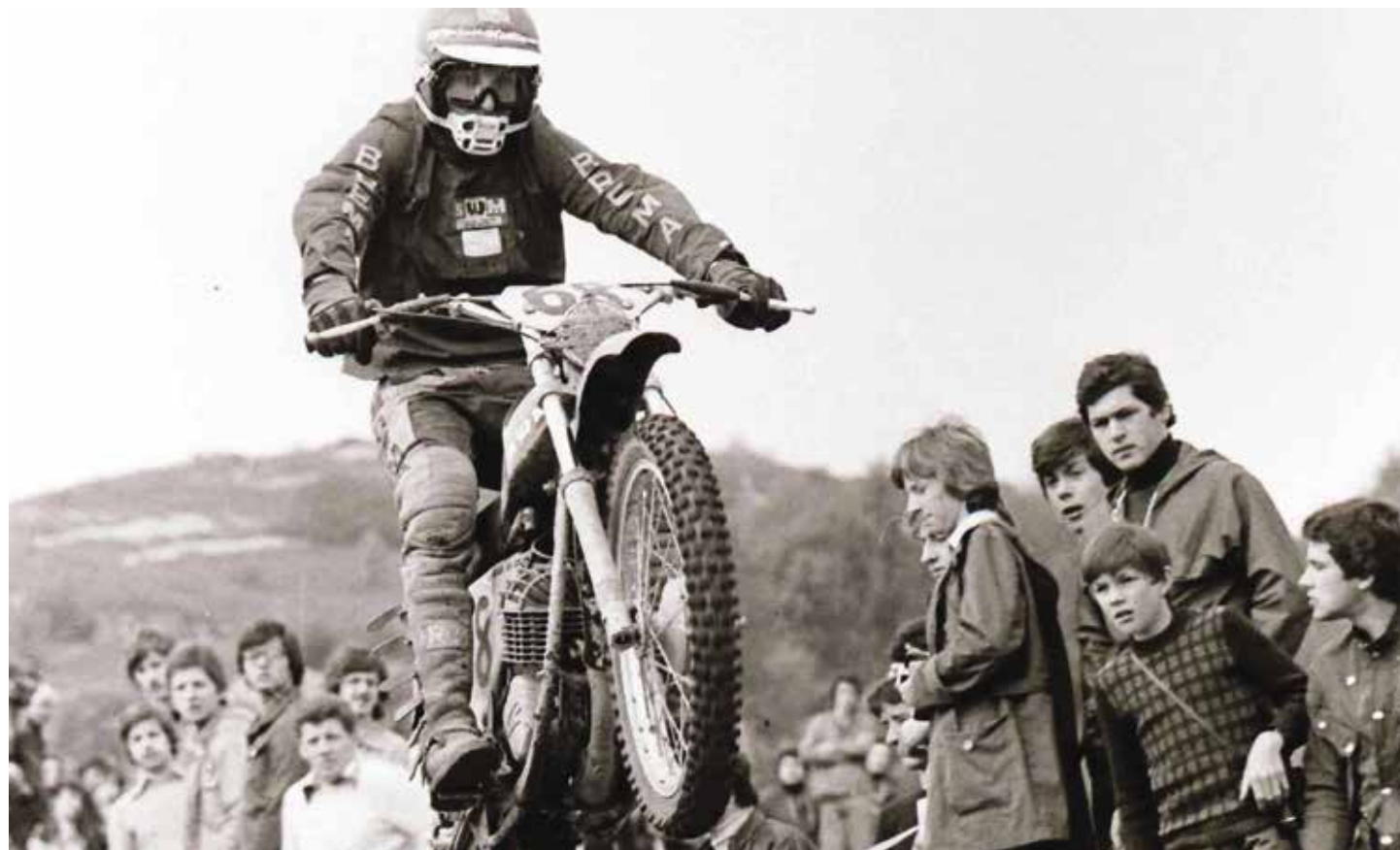
OFF ROAD SPIRIT