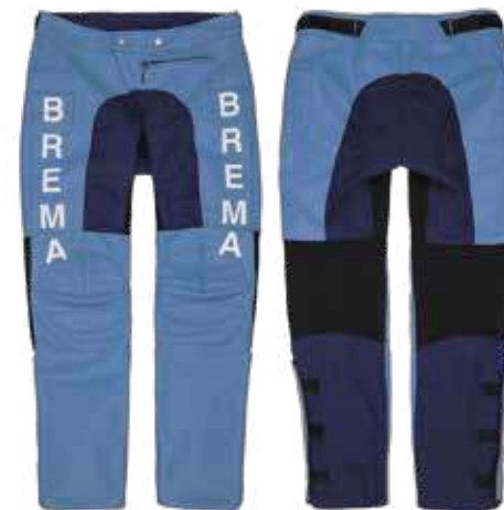
L. Blue/Navy 548